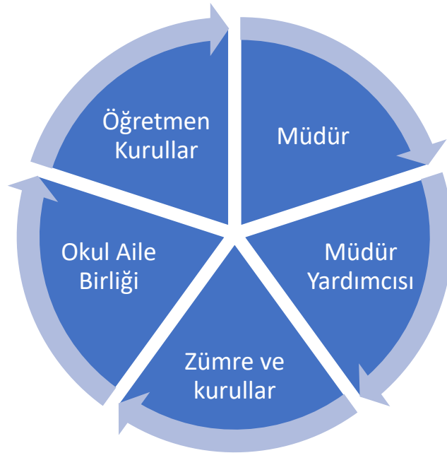
Şekil 1. Okul Temel Paydaşları

Stratejik Planlama sürecinde katılımcılığa önem veren kurumumuz tüm paydaşların görüş, talep, öneri ve desteklerinin stratejik planlama sürecine dâhil edilmesini hedeflemiştir. Akyazı Ortaokulu faaliyetleriyle ilgili sunulan hizmetlere ilişkin memnuniyetlerin saptanması konularında başta iç paydaşlar olmak üzere kamu kurumları, işverenler, sivil toplum kuruluşları, yerel yönetim ve yöneticilerinden oluşan dış paydaşların büyük bölümünün stratejik planlama sürecine katılımını sağlamıştır. Kurumun dışarıdan algılanması ve kuruma ilişkin beklentiler, kuruma ilişkin durum tespiti, kurumsal işbirliği ve eşgüdüm, GZFT, önerilerin tespiti vb. gerçekleştirmeye yönelik olarak Akyazı Ortaokulu Stratejik Planlama Ekibi ile toplantılar düzenlenmiş ve katılımcılığın paylaşımları sonucunda kurumumuzun paydaşlarla ilişkilerinin seviyesi ve önceliklerin tespit edilmesine çalışılmıştır. Akyazı Ortaokulu paydaşları, iç paydaşlar, dış paydaşlar temelinde ayrımlandırıldıktan sonra iç /dış paydaş okulumuz hakkındaki görüş ve önerilerini almak üzere mülakat veya anket yöntemi uygulanmıştır.